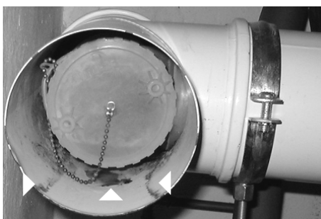
Rostschäden an einer Abgasleitung

Sonst können eventuell über die Zuluft, die von der Feuerstätte über den Ringspalt angesaugt wird, Schmutz- und Rußpartikel, sowie chemische Reststoffe, in die Feuerstätte gelangen und damit die neue Feuerstätte, sowie die Abgasleitung schädigen.